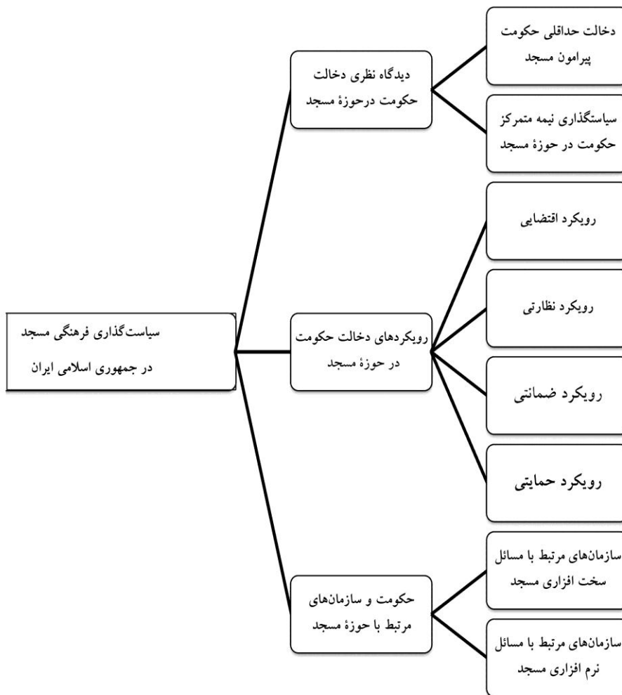
شکل ۱- شبکه مضامین تولیدشده پیرامون دیدگاه خبرگان پیرامون سیاست گذاری فرهنگی مسجد در جمهوری اسلامی ایران